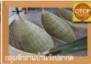
กลุ่มจักสานบ้านวังปลาต