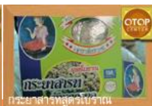
กระยาสารทสูตรโบราณ