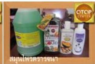
สมุนไพรตราจนา