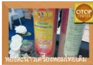
ห้องคนาวเครื่องหอมไทยเดิม