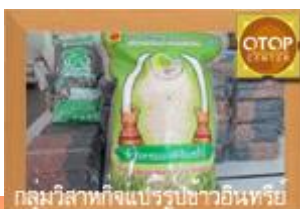
กลุ่มวิสาหกิจแปรรูปข้าวอินทรีย์