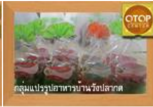
กลุ่มแปรรูปอาหารบ้านวังปลาต