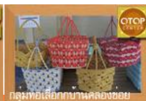
กลุ่มทอเสื่อกกบ้านคลองข่อย