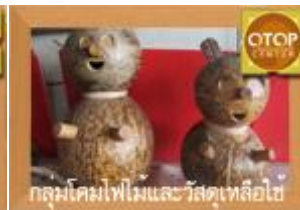
กลุ่มโคมไฟไม้และวัสดุเหลือใช้