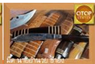
มีด นายอำเภอ ช่าง