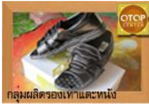
กลุ่มผลิตภัณฑ์รองเท้าหนัง