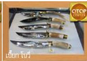
เบ็ก โบว์