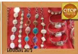
ไข่มุกซิลเวอร์