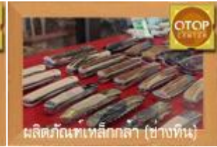
ผลิตภัณฑ์เหล็กกล้า (ช่างทำ)