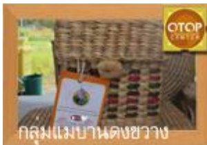
กลุ่มแม่บ้านดงขวาง