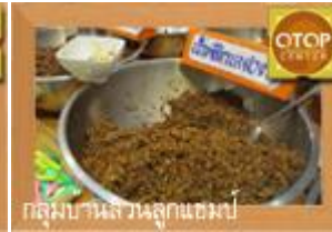
กลุ่มบ้านเส็กนุ๊กแฮมป์