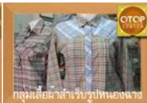
กลุ่มเสื้อผ้าสำเร็จรูปหนองฉาง