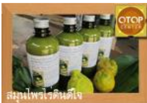
สมุนไพรโรดินด์ใจ